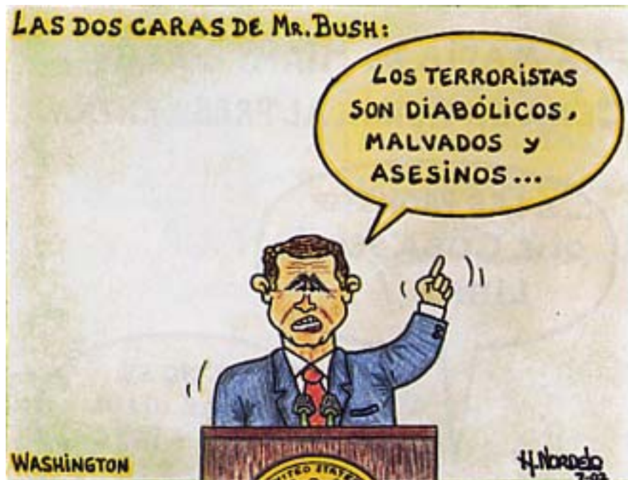
Die zwei Gesichter des Mr. Bush Die Terroristen sind teuflisch, schlecht und Mörder...