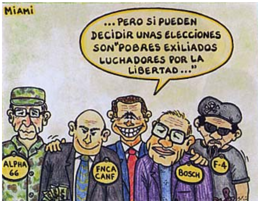
...aber wenn sie Wahlen entscheiden können, sind sie „arme Exilanten, die von der Freiheit vergoldet werden“.