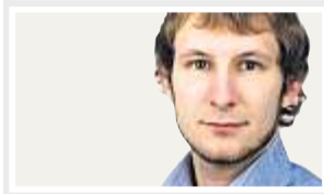
VON DOMINIK SCHLEIDGEN, MZ

Das war also die Popkomm 2010. Kleiner und bescheidener als in den Jahren zuvor. Statt Mega-Stars standen Newcomer auf den Bühnen. Und zum ersten Mal öffnete die Messe ihre Pforten für Besucher, die nicht in der Branche arbeiten. Die Musikindustrie