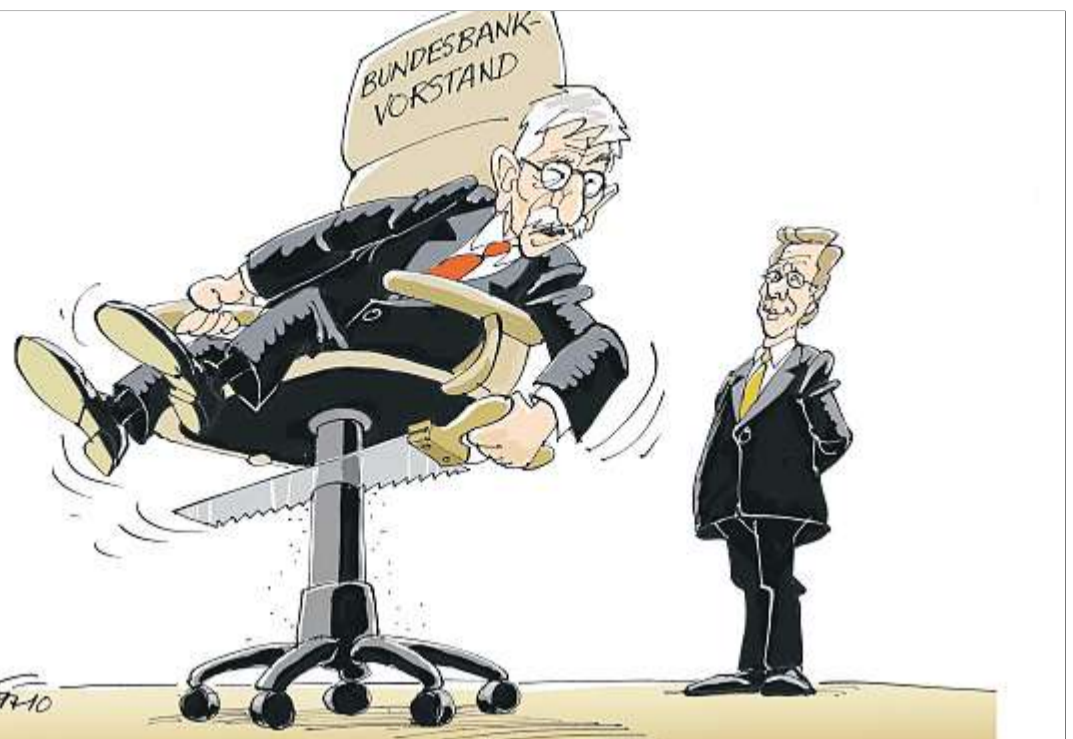
„Keine Sorge, ich mach's schon selber!“

Die Branche ist auf der Popkomm zusammengerückt und hat sich hinter ihren Nachwuchs gestellt. Jetzt muss sie Rückgrat beweisen.